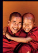
Campagnebeeld tentoonstelling DE BOEDDHA - Van levensloop tot Inspiratiebron , tot medio augustus in Leiden en vanaf eind september in Amsterdam.

Een reizend, glazen depot met daarin een verrassende selectie voorwerpen, op pleinen en treinstations door heel Nederland. Dat is het nieuwe project Magazijn van de Wereld waarvan de realisatie, dankzij een bijdrage van de BankGiro Loterij, in 2016 start. Tijdens dit drie jaar durende project staan de minimusea ieder jaar op een ander station. Een unieke kans om bijzondere selecties uit de enorme hoeveelheid collectie die in onze museumdepots verborgen ligt aan een nieuw publiek te tonen.